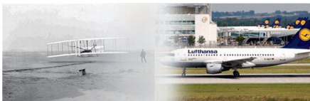
Vom Strand zum Flughafen in rund 100 Jahren

Für den ersten motorisierten Flug mit einem Flugzeug im Jahre 1903, den die Gebrüder Wright absolvierten, war nicht mehr nötig als ein Strandschnitz in Kittyhawk in den Vereinigten Staaten. Keine Beleuchtung, keine Kommunikation und auch keine Passagiere. Im Laufe der Zeit und mit dem Wachstum der Zivilluftfahrt änderte sich der Bedarf jedoch. Man brauchte komplett ausgestattete Flughäfen mit befestigten Start- und Landebahnen, Tower, elektrischen Systemen zur Sicherung und Kommunikation, Terminals und allen möglichen anderen Einrichtungen, wie wir sie heute auf allen kleinen und großen Flughäfen der Welt sehen können. Es versteht sich von selbst, dass die Flughäfen des Jahres 2012 mit der allermodernsten Technik auf dem Gebiet der Kommunikation, Gepäckabfertigung, Informationsbereitstellung, Sicherheit, Klimatisierung, Beleuchtung und mit allem, was irgendwie mit Technik zu tun hat, ausgestattet sind. Die Tecline-Mitarbeiter wissen alles hierüber, haben sie doch schon einige Male auf verschiedenen Flughäfen gearbeitet, um solche Installationen einzurichten. Auf dem Flughafen Schiphol in Amsterdam ist ein Mitarbeiterteam täglich mit der Wartung der Brandschutzsysteme beschäftigt. Im Untergeschoss dieses